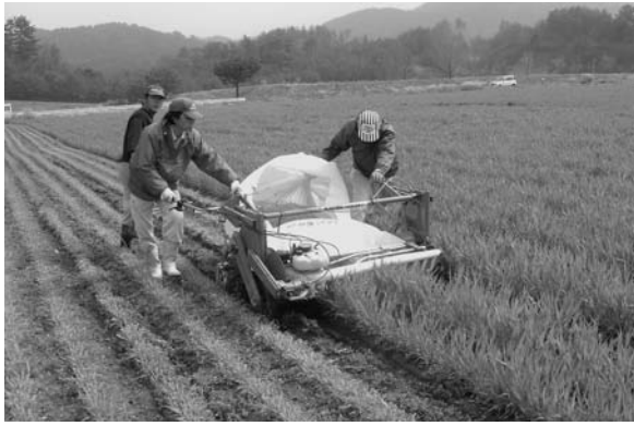
大麦若葉の刈り取り作業

① 雇用の場の確保については、次の2点について、具体的に町長の考えを伺う。 ② 団塊の世代への呼びかけは、