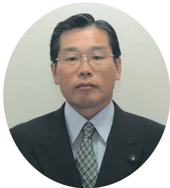
伊藤 豊 議員