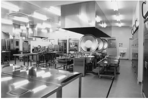
給食センター調理室

3月中の準備稼働状況は、15日竣工式、17日センター内の全体清掃、21日引越し及び消毒、同日調理機器のメーカーによる操作点検方法の実習、22日調理したものを学校へ提供、23日中学校へ給食提供予定、春休みに調理機器の清掃、操作、消毒方法等を再点検し、万全の体制で新年度に備えた。次にノロウイルスについて、特に1月、2月が発生のピークといわれており通常毎月2回の検便と、2月にノロウイルス