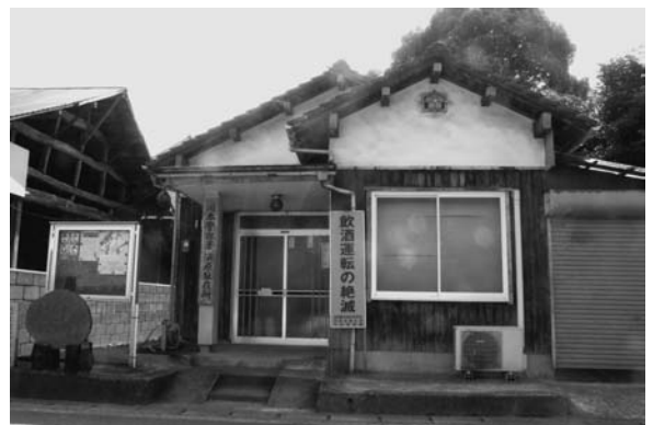
老朽化のはげしい浜原駐在所