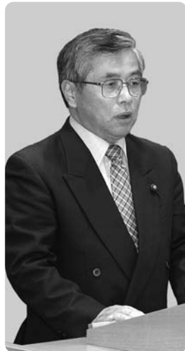
高橋 弘紀 議員