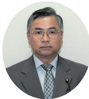
高橋 紘紀 議員