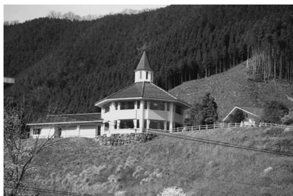
ゴールデンユートピアおおち

① いわゆる箱物施設の運営と維持管理に要する経費について、19年度予算で云うと、運営委託費5300万円、維持管理費、800万円を予算計