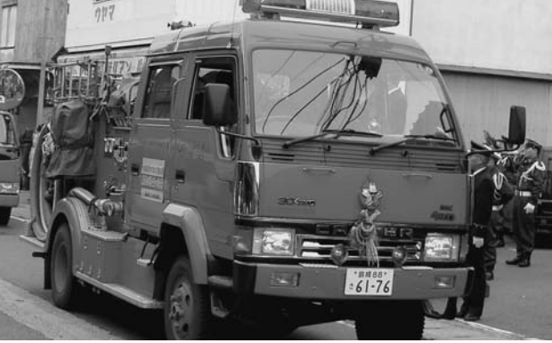
分団消防ポンプ車

対し、305名である。このうち自動車分団は15名で活動している。 合併時の消防役員会において、自動車分団の出動範囲は、邑智地域全域と大和地域の長藤曲利J.R高架地点までとなっている。それ以外の大和地区へは、大和事務所分団が出動することになっているが、大和事務所分団は合併後、殆どの団員が本庁に勤務している関係もあり、日中の火災に対する対応が以前より低下している。機敏な対応を進めるよう心がけてはいる。 現状をふまえ、この問題は美郷町消防団の意向、団員の負担を考え、今後検討したい。